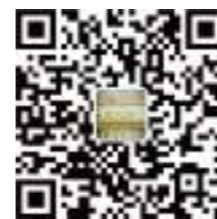
“成都高新区文化馆”二维码

我馆现有线上服务平台账号2个,包括微信公众号、“高新文化”APP,用于提供或发布在线课程、线上活动、线下活动预告与回顾、公示公告和课程报名等信息。