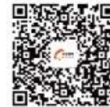
“高新文化”APP二维码(安卓)